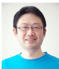
運動科学総合研究所 専門達人調整員

運動総研の講座・教室、およびカルチャースクールでゆる体操受講経験のある男性の方のみ承ります。